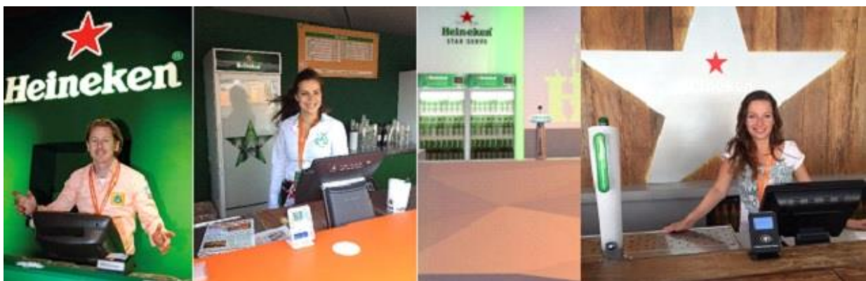
Creo in het HHH – Vancouver 2010 – Londen 2012 – Sochi 2014 – Rio 2016