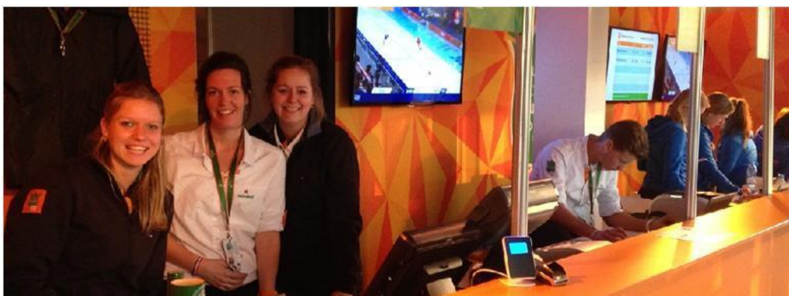
Creo cashless payment in de merchandise shop van het Holland Heineken House.